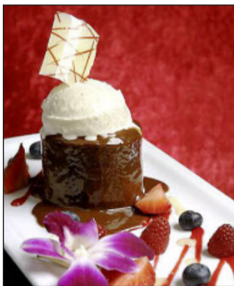
Un dessert au chocolat pour des papilles en folie.

Un petit coin d'Asie sur fond d'ambiance zen et de gastronomie raffinée: c'est près de la place Neuve, face au parc des bastions, au cœur de la Cité de Calvin, que le Little Buddha, calqué sur le fameux Buddha Bar de Paris, prendra ses quartiers. L'établissement