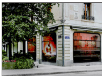
La vitrine de l'établissement, qui ouvrira ses portes en automne.

mètres carrés. Au rez-de-chaussée, dans un décor inspiré du continent asiatique où trônera une imposante statue de Bouddha, un restaurant pourra accueillir une centaine de convives. Il servira une cuisine inventive aux influences asiatiques et françaises. Au sous-sol, un lounge bar proposera des soirées animées par un DJ.