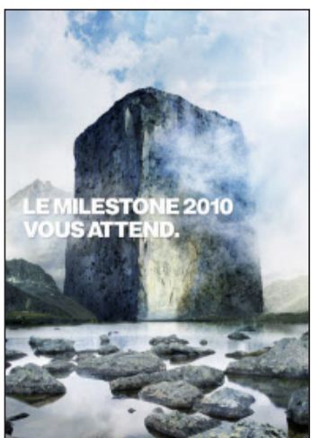
La cérémonie de remise des prix aura lieu le 16 novembre.

Adaptation Françoise Zimmerli sur la base d'un article en page 3