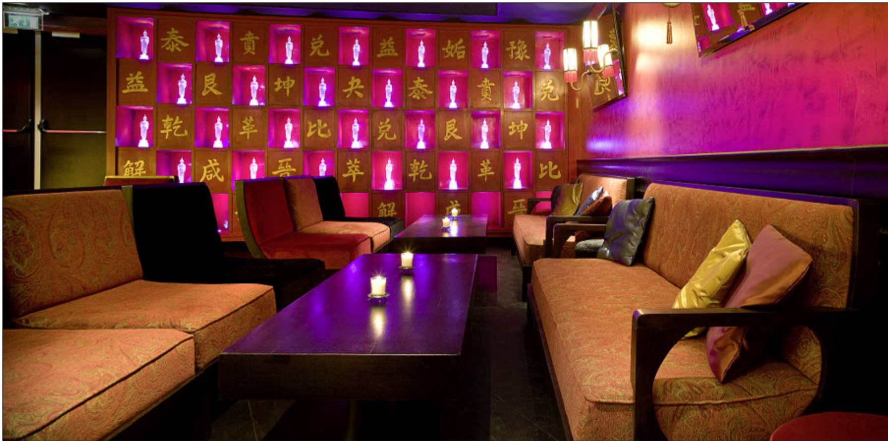
Le lounge bar, ici celui du Little Buddha d'Amsterdam, sera égayé par une décoration raffinée aux couleurs chaudes d'inspiration asiatique.