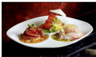
La cuisine japonaise sera à l'honneur avec des tatakis.

ment, franchisé à l'enseigne du groupe français George V Entertainment, occupera deux étages sur une surface de 400